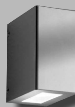
CMD 112- geschlossen-breit