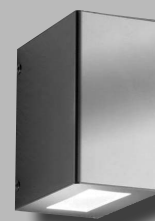
CMD 111- Linse verstellbar