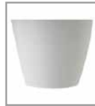
Kunststoffgleiter grau oder schwarz